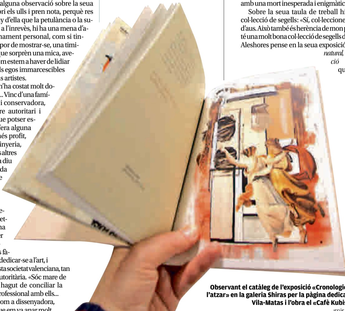
Observant el catàleg de l'exposició «Cronologies de l'atzar» en la galeria Shiras per la pàgina dedicada a Vila-Matas i l'obra el «Cafè Kubista».